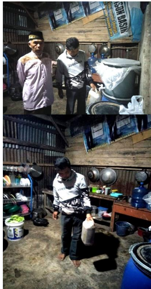
Gambar 4. Pupuk Organik Cair yang siap dipanen 14 hari setelah proses fermentasi

pertumbuhan seimbang, populasi mikroorganisme semakin berkurang, karena mikroorganisme memasuki fase kematian, sehingga berpengaruh terhadap aktivitas pembentukan nitrogen dan fosfor. Bahan organik mengalami dekomposisi melalui penguraian c-organik yang ada. Menurut Yuniarti, et al., (2017), kombinasi pemberian pupuk NPK 2 g.tanaman -1 dan POC 1 g.tanaman -1 menghasilkan bobot tanaman pakcoy 32,67 t.ha -1 , melampaui potensi produktivitas pakcoy 30 t.ha -1 . Hal ini disebabkan POC mampu meningkatkan aktivitas mikroorganisme dalam menyediakan hara bagi tanaman.