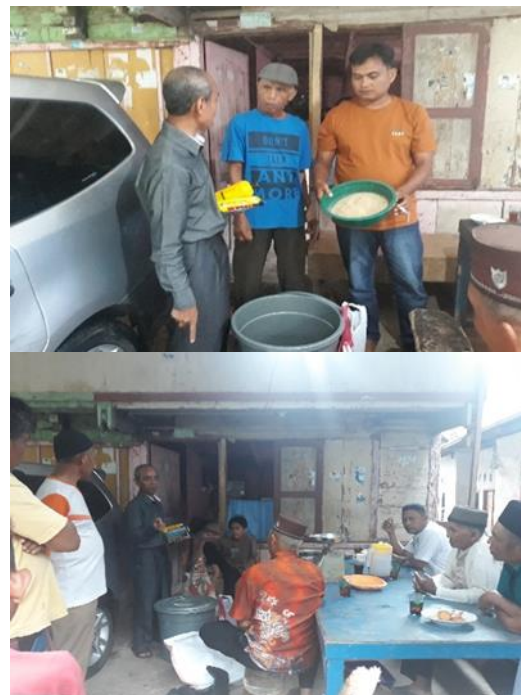
Gambar 3. Persiapan pembuatan pupuk organik cair didampingi oleh petugas penyuluh pertanian lapangan

Trichoderma sp. sebagai mikroorganisme fungsional, yaitu berfungsi sebagai organisme pengurai, stimulator pertumbuhan tanaman dan sebagai biodekomposer, mendekomposisi limbah organik menjadi bahan organik yang berkualitas baik (Juliana et al., 2017). Menurut Charisma et al., (2012), dekomposisi bahan organik menggunakan Trichoderma sp. sebagai bioaktivator mampu manambah ketersediaan hara pada tanah, secara fisik porositas dan aerase tanah menjadi lebih baik bagi perakaran tanaman dan kemampuan tanah mengabsorpsi dan menahan air lebih baik dalam menjamin tersedianya hara dan air bagi pertumbuhan tanaman.