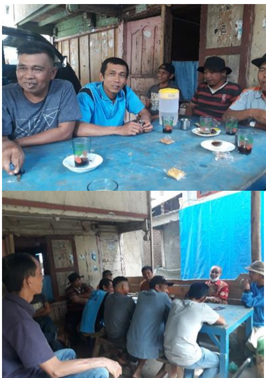
Gambar 2. Sosialisasi kepada petani tentang pentingnya pemupukan bagi tanaman dengan pemanfaatan pupuk organik cair dalam meningkatkan hasil tanaman

tersedianya hara dalam menjamin produktivitas tanaman yang dibudiyakan. Sosialisasi yang telah dilakukan mendapatkan perhatian yang cukup serius petani dan petani lain. Petani memahami pentingnya pupuk organik cair dalam upaya meningkatkan hasil tanaman, sehingga diharapkan mampu memberikan motivasi petani untuk menggalakan penggunaan pupuk organik cair.