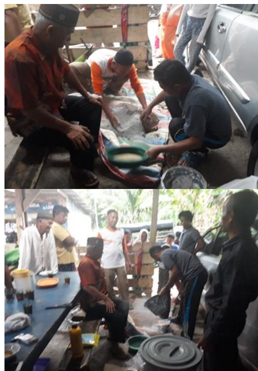
Gambar 4. Pembuatan pupuk organik cair dengan menggunakan bioaktivator EM4 dan Trico-G

Fungsi pupuk organik cair selain ditentukan oleh bioaktivator, juga ditentukan oleh sumber bahan organik yang digunakan. Hara yang tersedia bagi tanaman dipengaruhi oleh jenis bahan baku yang digunakan dalam pembuatan pupuk organik cair. Pupuk organik cair yang berasal dari kotoran hewan lebih banyak memberikan kontribusi bagi tersedianya hara N selain P dan K. Sekam padi memberikan ketersediaan hara kalium. Bahan baku yang digunakan bisa dikembangkan sesuai dengan kebutuhannya.